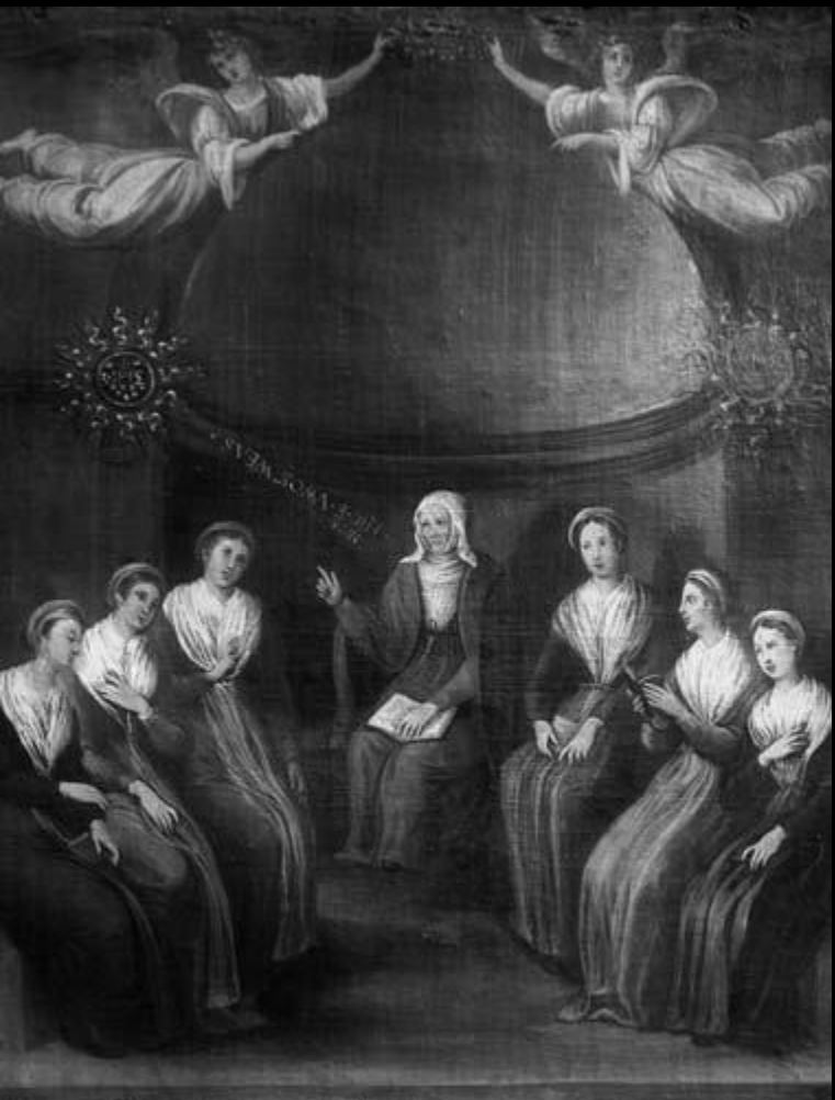
LA B. AGELA BRISCIANA VERGINE FONDATRICE DELLA NOVA CÖGREGATIOE DE VERGINE DETTA LA CÖPAGNIA DI S. ORSOLO